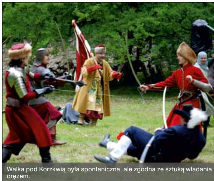
Walka pod Korzkwią była spontaniczna, ale zgodna ze sztuką władania orężem.

Na tegoroczny rajd rowerowy organizatorzy z Centrum Kultury w Zielonkach zaplanowali ciekawą trasę wiodącą przez centrum Zielonek, dalej ulicą Na Ogrody do Hotelu Twierdza, Drogą Królewską w kierunku Woli Zachariaszowskiej i na Garliczkę, by zakończyć na zamkowej polanie w Korzkwi.