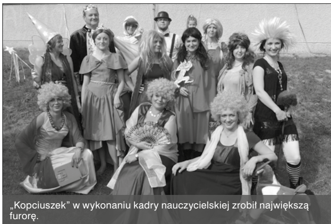
„Kopciuszek” w wykonaniu kadry nauczycielskiej zrobił największą furorę.