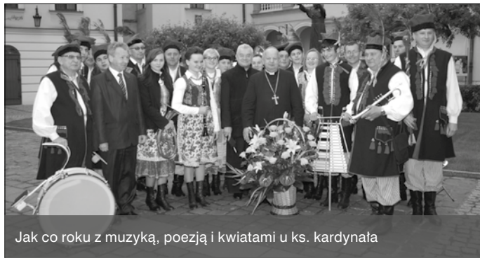
Jak co roku z muzyką, poezją i kwiatami u ks. kardynała