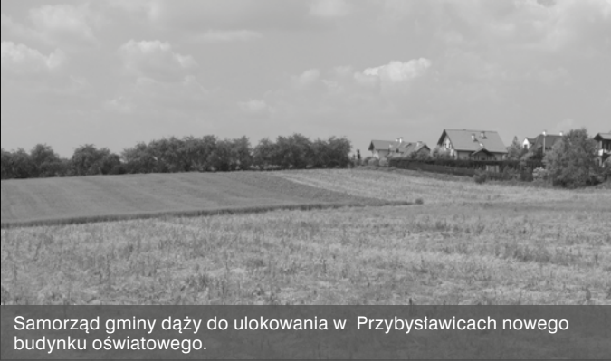
Samorząd gminy dąży do ulokowania w Przybysławicach nowego budynku oświatowego.