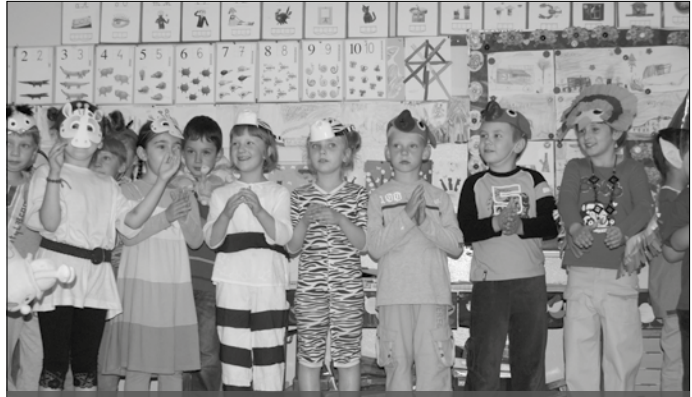
Zerówkowicze z Korzkwi bawią się w teatr... po angielsku.