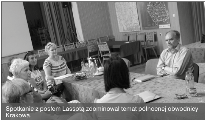
Spotkanie z posłem Lassotą zdominował temat północnej obwodnicy Krakowa.