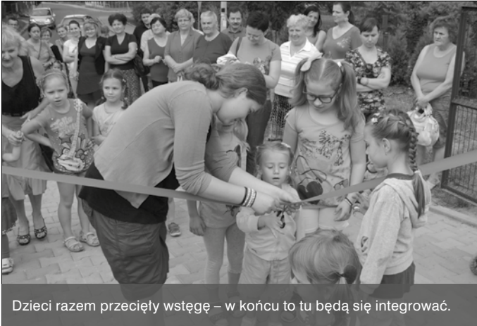
Dzieci razem przecięły wstęgę – w końcu to tu będą się integrować.