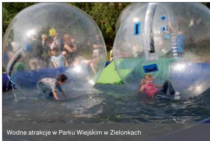
Wodne atrakcje w Parku Wiejskim w Zielonkach