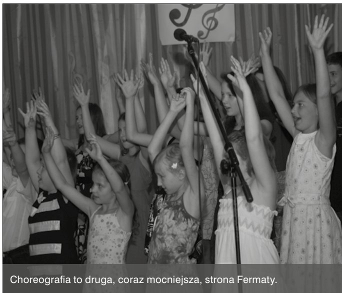
Choreografia to druga, coraz mocniejsza, strona Fermaty.