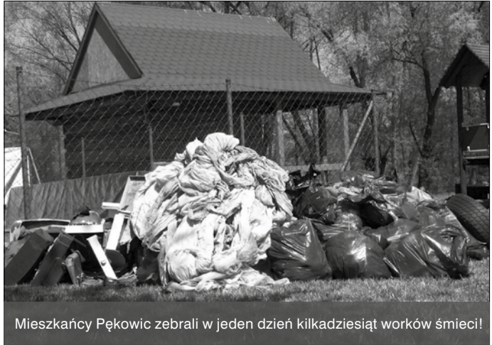
Mieszkańcy Pękowic zebrali w jeden dzień kilkadziesiąt worków śmieci!