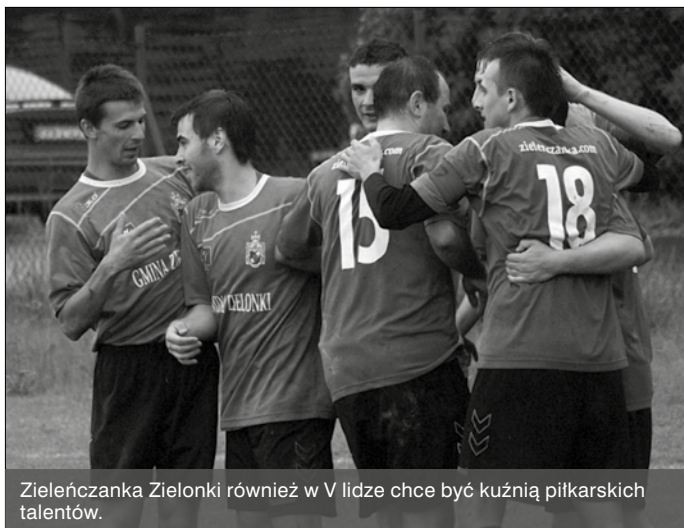
Zieleńczanka Zielonki również w V lidze chce być kuźnią piłkarskich talentów.