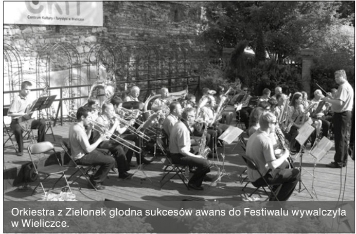
Orkiestra z Zielonek głodna sukcesów awans do Festiwalu wywalczyła w Wieliczce.