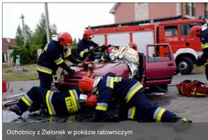
Ochotnicy z Zielonek w pokazie ratowniczym