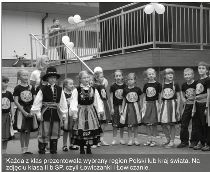
Każda z klas prezentowała wybrany region Polski lub kraj świata. Na zdjęciu klasa II b SP, czyli Łowiczanki i Łowiczanie.