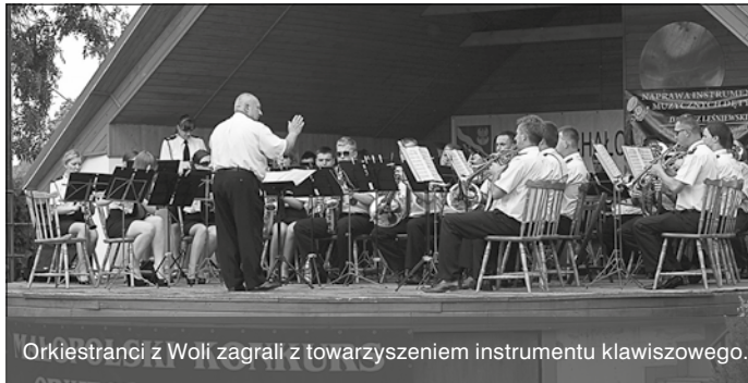
Orkiestranci z Woli zagrali z towarzyszeniem instrumentu klawiszowego.