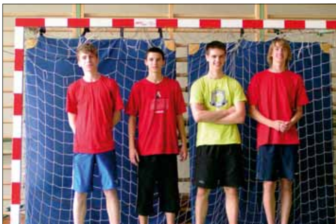
Portugalia, czyli gimnazjaliści z III c okazali się mistrzami podczas EURO w Bibicach.