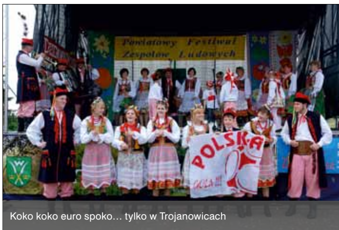
Koko koko euro spoko... tylko w Trojanowicach

III Festiwal Zespołów Ludowych w Zielonkach zgromadził liczną publiczność. Jedni przyszli oglądać i słuchać, wielu przyprowadziło pociechy na odbywający się równocześnie w Parku Wiejskim festyn z okazji Dnia Dziecka. Mocno weszły „Pawie Pióra” po śląsku, „Chochliki” z suitą łowicką, „Alebabki” z pieśnią na ustach, „Tradycja” z Trojanowic z piłkarskim akcentem, „Zdrojanie” na sposób francuski, a wreszcie „Lachy” z Nowego Sącza włączyły do tańca na scenie i pod sceną widzów. Muzyczną podróż po Małopolsce i innych regionach zapewniło 3 czerwca sześć grup tanecznych i śpiewających.