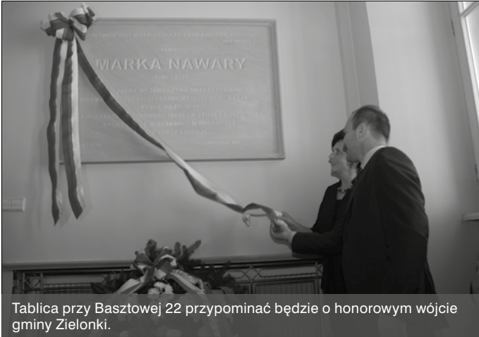
Tablica przy Basztowej 22 przypominać będzie o honorowym wójcie gminy Zielonki.