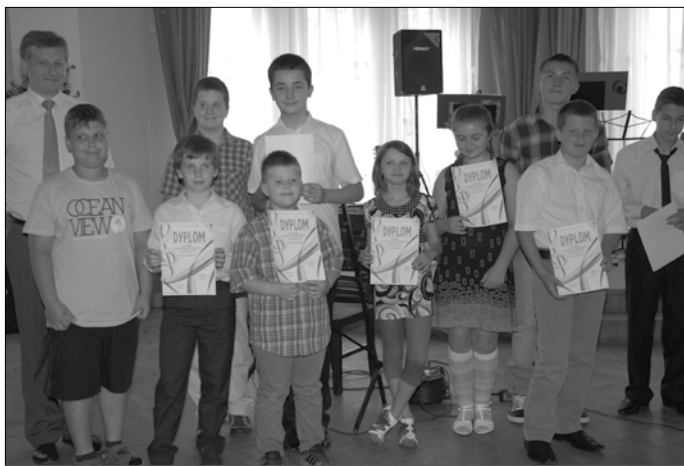
Publiczność miło spędziła czas słuchając młodych muzyków w różnorodnym repertuarze i barwej konferansjerki ich nauczyciela.