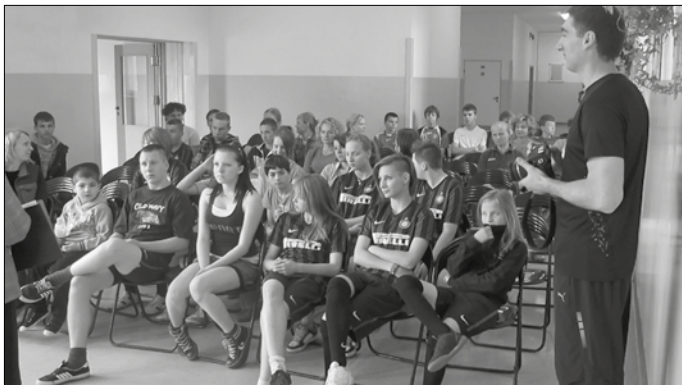
Rozgrywki sportowe i wspólne ognisko to może być przepis na udaną zabawę w Dzień Dziecka – zdecydowali wspólnie dyrekcja Zespołu Szkół w Bibicach i menadżerowie z Capgemini.