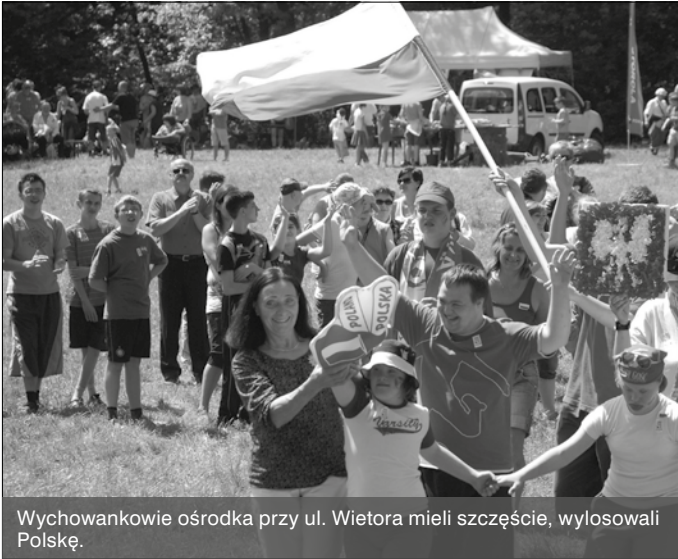
Wychowankowie ośrodka przy ul. Wietora mieli szczęście, wylosowali Polskę.