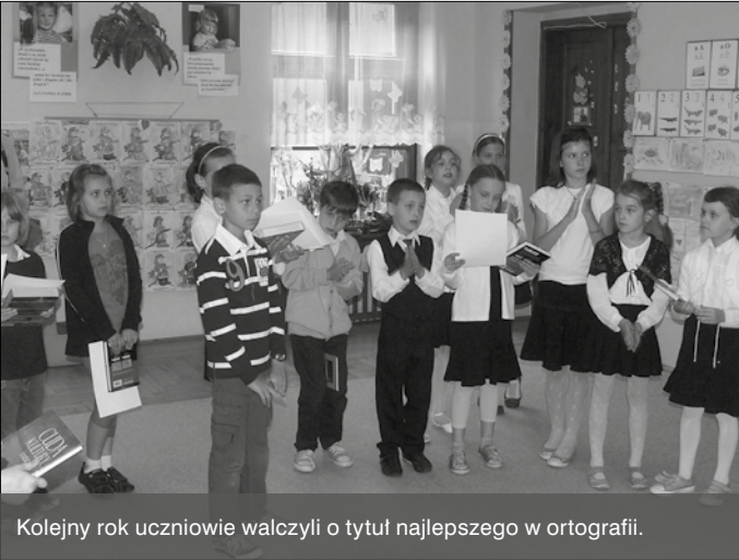
Kolejny rok uczniowie walczyli o tytuł najlepszego w ortografii.