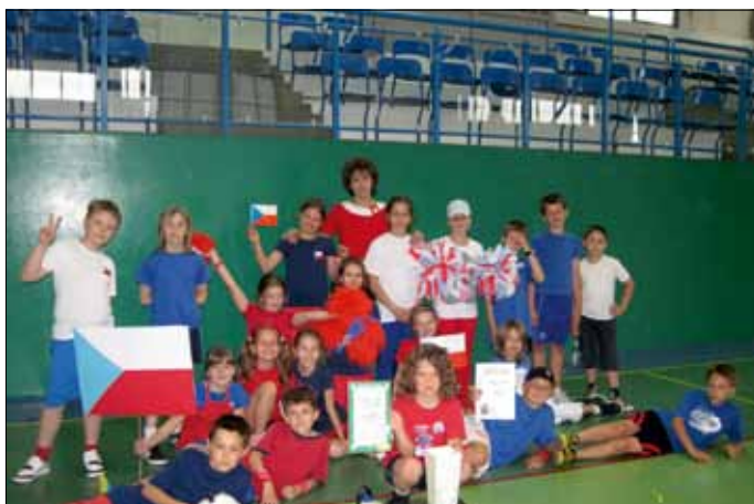
Puchar MINIEURO 2012 w Zielonkach zdobyła drużyna Czech, czyli klasa III b.