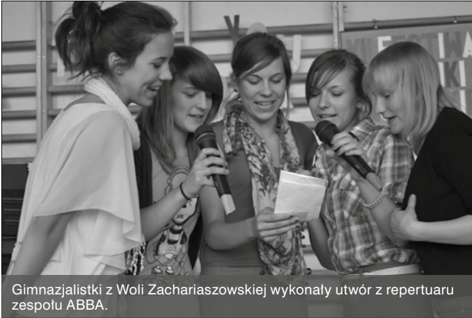
Gimnazjalistki z Woli Zachariaszowskiej wykonały utwór z repertuaru zespołu ABBA.