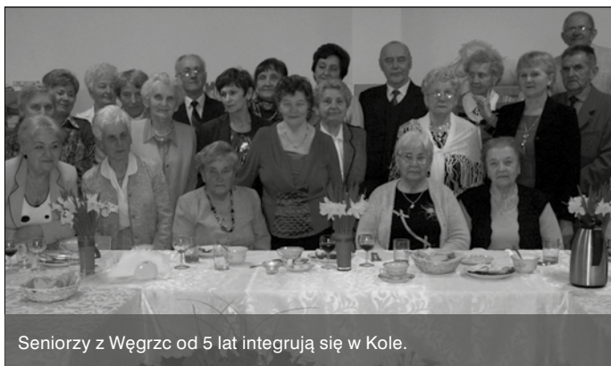
Seniorzy z Węgrzc od 5 lat integrują się w Kole.