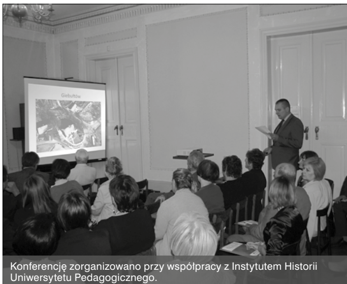
Konferencję zorganizowano przy współpracy z Instytutem Historii Uniwersytetu Pedagogicznego.