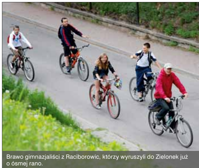
Brawo gimnazjaliści z Raciborowic, którzy wyruszyli do Zielonek już o ósmej rano.

12 maja przed zamkiem w Korzkwi spotkali się rowerzyści i rycerze. Rajd rowerowy rozpoczął się Gwiazdowym Złotem przed halą sportową w Zielonkach, gdzie jego uczestnicy rozgrzewali się na strzelnicy. Na metę pod zamkiem w Korzkwi nadjechali, trafiając akurat na inscenizację bitwy z 1587 roku i pokazy sztuki rycerskiej. Atrakcje upamiętniającą krwawą bitwę zorganizowało Stowarzyszenie Korzkiew.