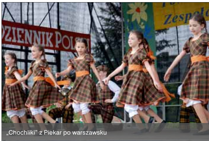
„Chochliki” z Piekar po warszawsku