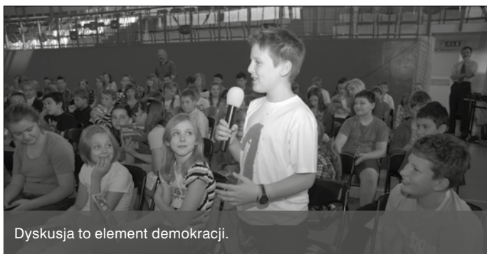
Dyskusja to element demokracji.