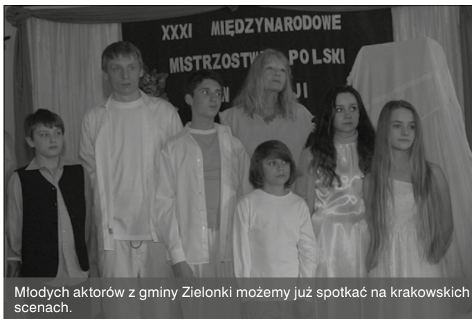
Młodych aktorów z gminy Zielonki możemy już spotkać na krakowskich scenach.