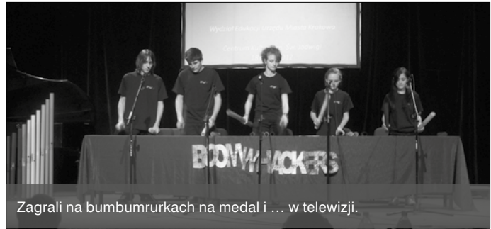
Zagrali na bumbumrurkach na medal i ... w telewizji.

Wszelkie informacje udzielane są w Gminnym Zespole Ekonomiczno-Administracyjnym Szkół w Zielonkach, ul. Galicyjska 17 (II piętro), pokój nr 2, tel. 12 285 02 98, wewn. 111.