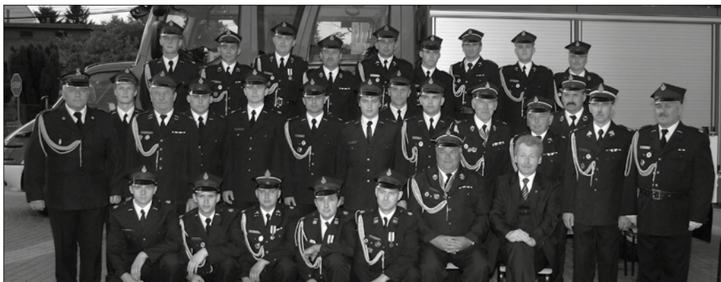
Strażacy z OSP Węgrzce. Do węgrzeckiej jednostki co roku zgłasza się przynajmniej dwóch młodych strażaków.