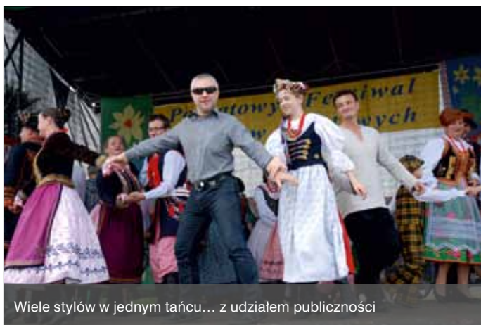
Wiele stylów w jednym tańcu... z udziałem publiczności