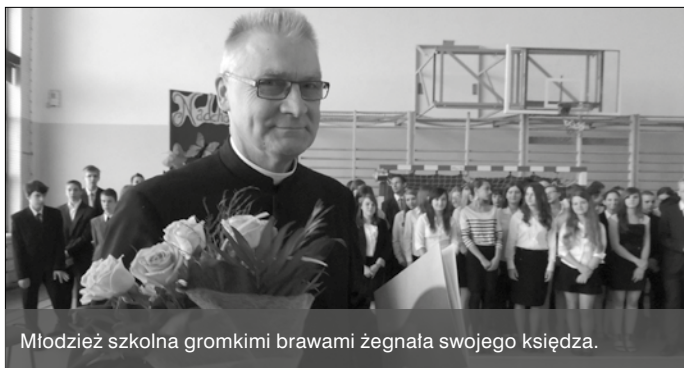
Młodzież szkolna gromkimi brawami żegnała swojego księdza.