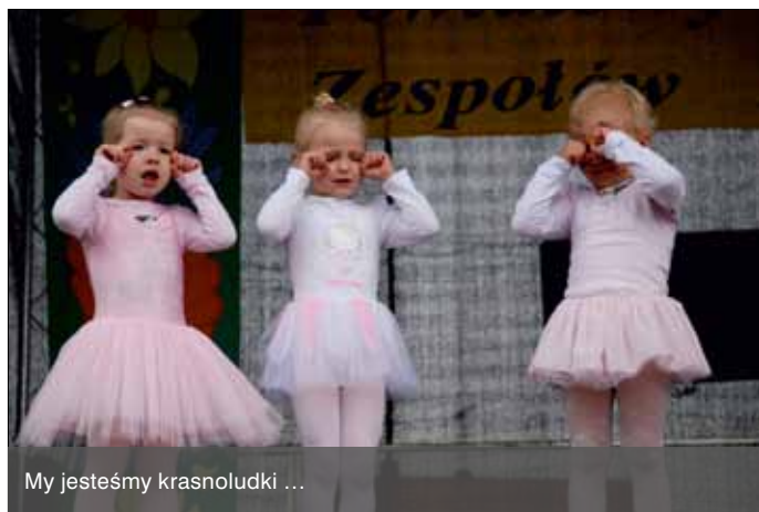
My jesteśmy krasnoludki ...

Już nieraz Park Wiejski w Zielonkach był areną obchodów Dnia Dziecka. Ale niestety, te imprezy szczęścia do pogody nie mają. Na pewno mają jednak szczęście do dzieci, które licznie odwiedzają to miejsce. 3 czerwca można było wyzywać się plastycznie, zjeżdżać, skakać i pływać bez zamoczenia ubrania. A pod koniec zabawy podziwiać swoich rówieśników bawiących się teatrem i tańcem.