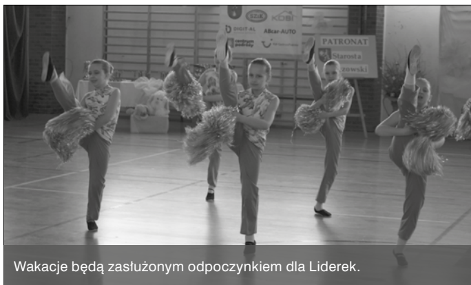
Wakacje będą zasłużonym odpoczynkiem dla Lidererek.