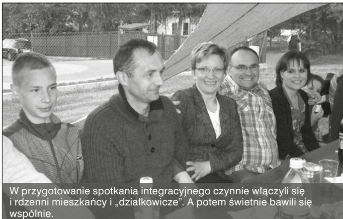
W przygotowanie spotkania integracyjnego czynnie włączyli się i rdzenni mieszkańcy i „działkowicze”. A potem świetnie bawili się wspólnie.