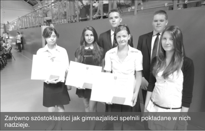
Zarówno szóstoklasiści jak gimnazjaliści spełnili pokładane w nich nadzieje.